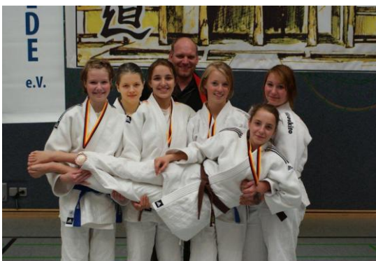
Die U17 Mannschaft der Mädels 3. Patz auf den LMM